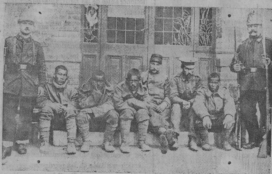
Prisioneros indios, franceses e ingleses en poder de los alemanes.