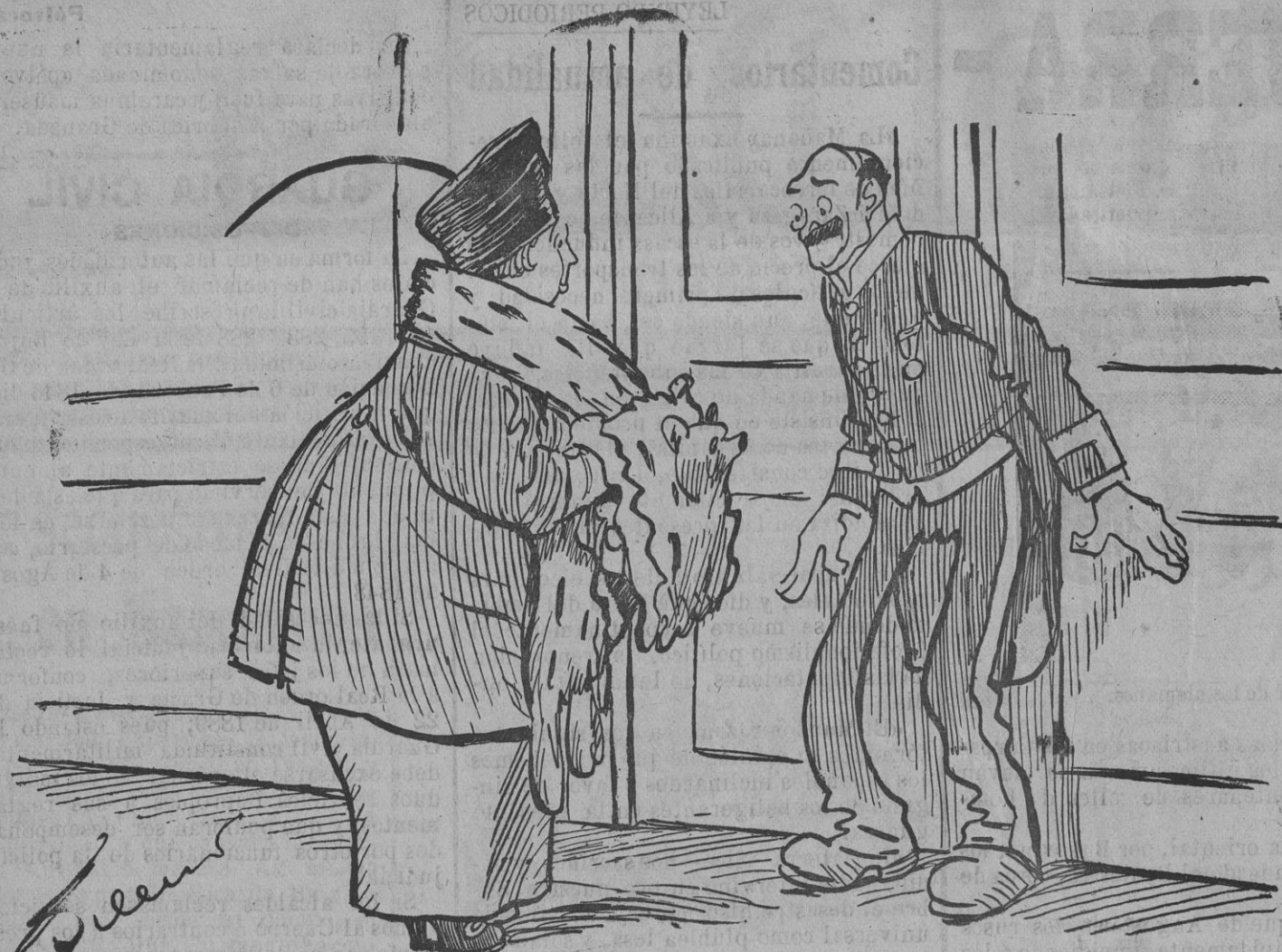
—Imposible, señora... No puede usted pasar á ver al señor ministro. ¡Está con una Comisión de comerciantes en cueros!