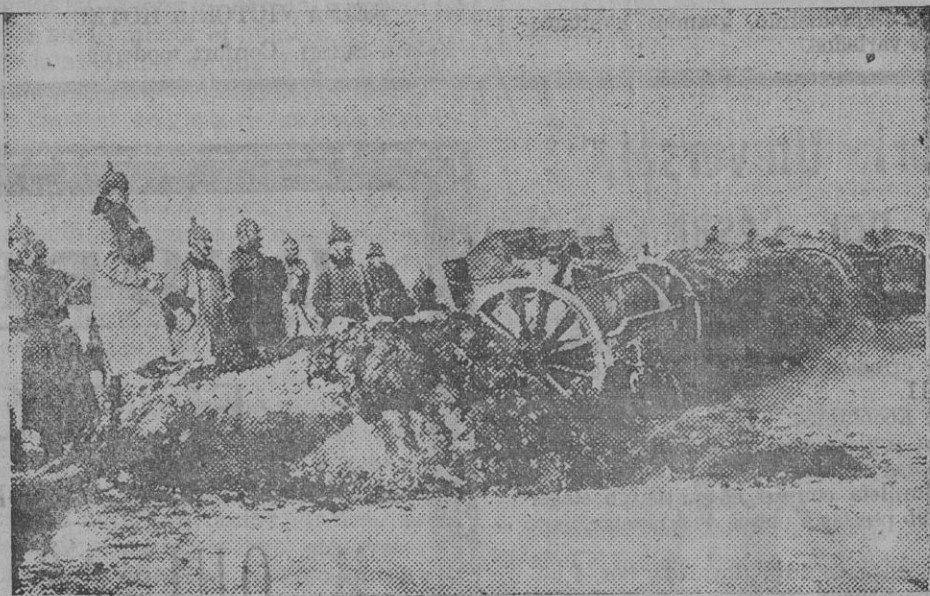
Baterías alemanas empleadas en una línea de fuego de Polonia

Eso es intolerable é imposible de que continúe, y el corresponsal de «El Imparcial» está obligado—y esperamos que cumpla—á hablar con toda claridad para que se castigue inexorablemente á los culpables, sean quien sean, porque no se lanza una mancha tan grande como esa sobre una nación, porque sobre España