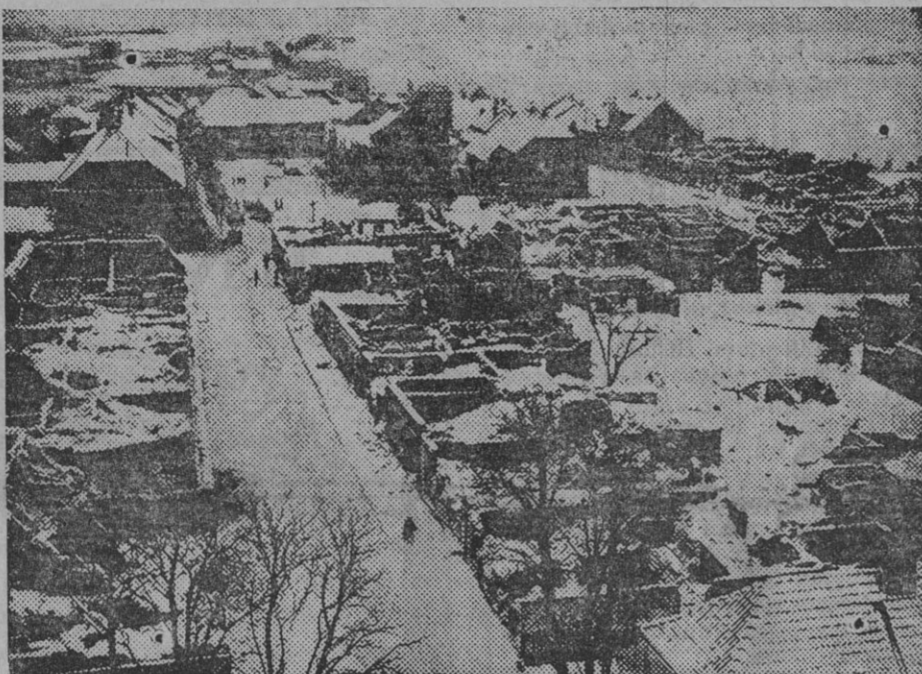
Aspecto actual de Gerdauen, ciudad de la Prusia oriental, destruída por los rusos.

Donde las necesidades lo indicaron, se construyeron escuelas y dispensarios, y