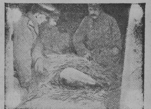
Una de las bombas que no llegaron a e talar de las arrojadas por los zepelines sobre Yarmouth.

Cuando entraron los rusos en la ciudad, sólo había en ella unos 5.000 habitantes.