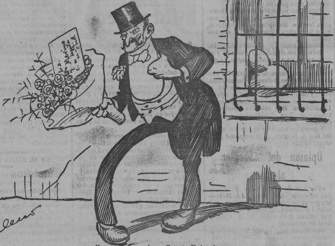
[Compuesto y sin... García Prieto]