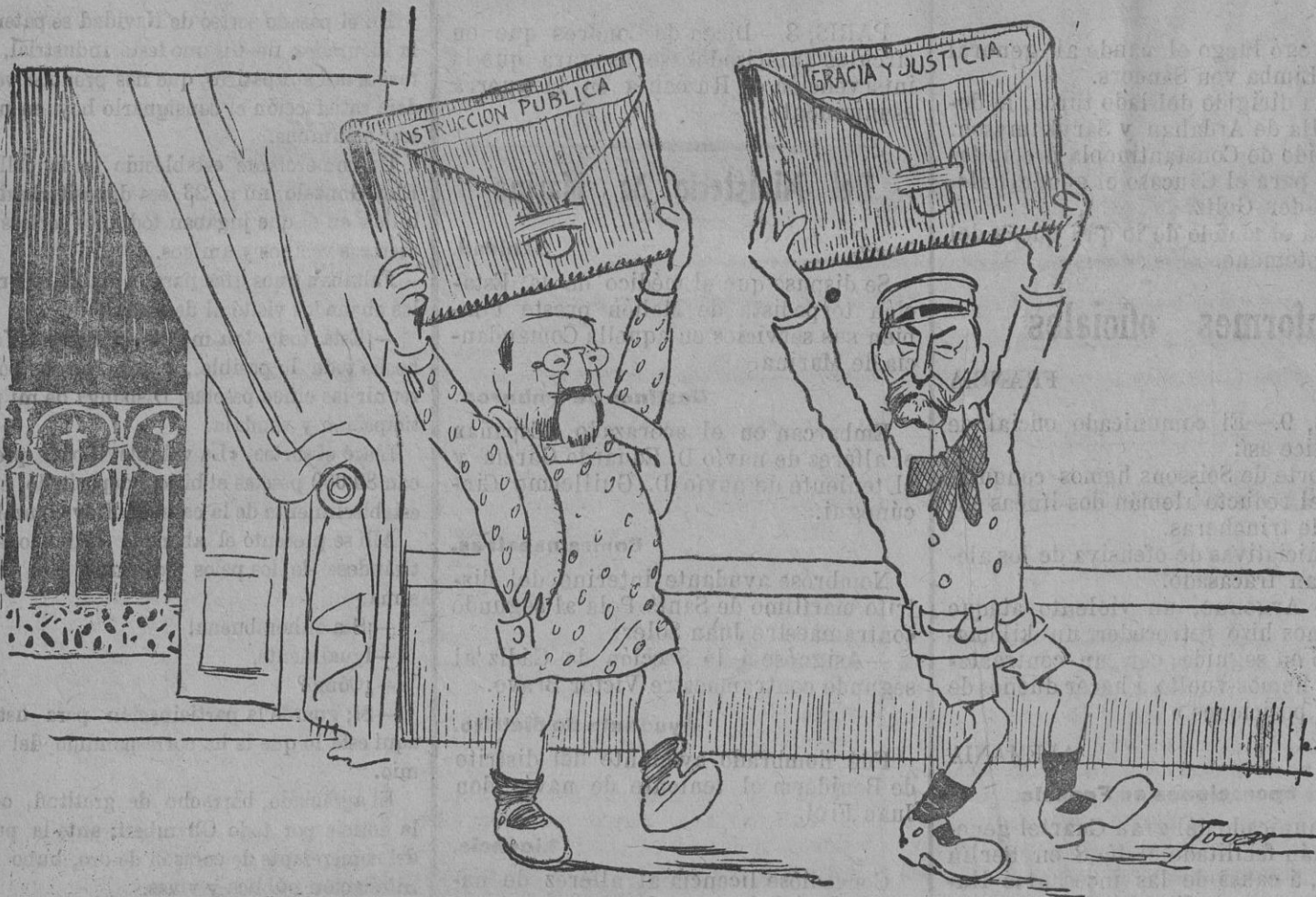
— ¡Vaya si se han porta to los reyes!