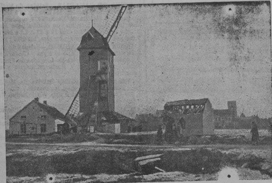
EN RAMSCAPPELE (FLANDES).—Un molino de Flandes, una de cuyas aspas ha sido alcanzada por un obús alemán.

El torpedero sumergible de escuadra se considera también logrado, merced á las características que las casas constructoras esperan obtener para los modelos en construcción, sobre todo en lo que á la velocidad respecta, que alcanzará 20 millas en la superficie; pero no ha tenido, que sepamos, una consolidada