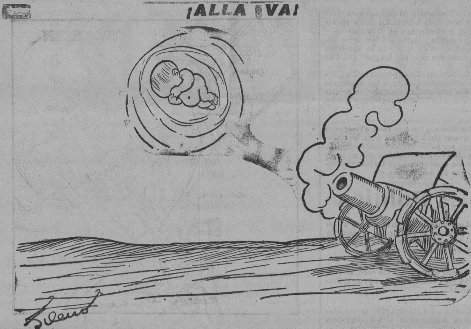
EL NUMERO 1915

Ya no me encontraba entre dos Cielos. Enonces pude seguir mi deseado viaje, emprendiendo la marcha no tan fatigado como la primera, atravesando el ya referido bosque del Reventón, yendo á descansar á la sombra del célebre pino de la