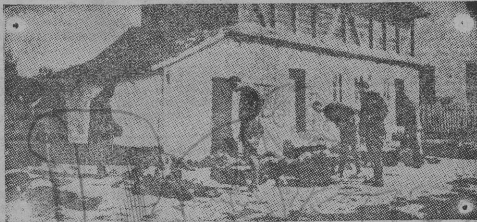
Cadáveres de servicios yacientes en las proximidades de Sabatz.