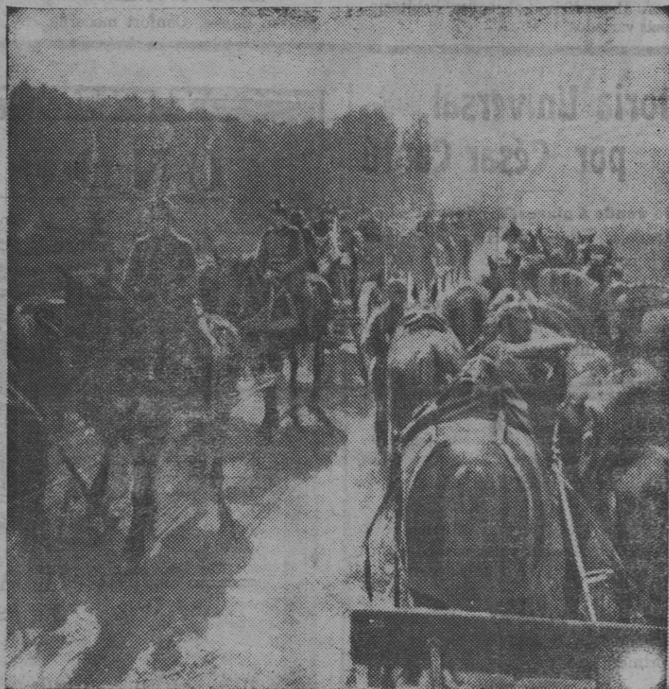
Un convoy alemán camino de Amberes.

güe no se propone nada de lo que perjudique sin necesidad, tenemos la evidencia de que esto será aclarado, como también otros puntos que indicaremos otro día, para no hacer demasiado largo este trabajo.