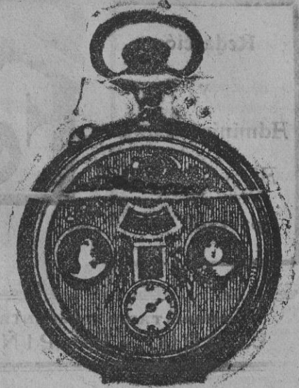
El maravilloso reloj automático

Horas de despacho: De 8 á 10 mañana y de 6 á 8 tarde.