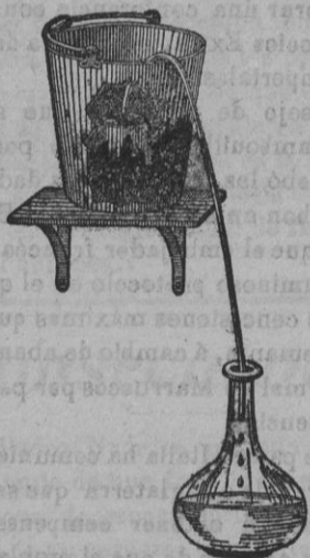
Grabado núm. 1.

PARA USO DOMÉSTICO: se conservará la salud.