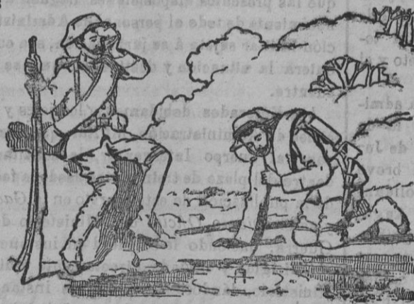
Grabado núm. 2.

Madrid.—FARMACIA, 6, principales.—Apartado de Correos núm. 329