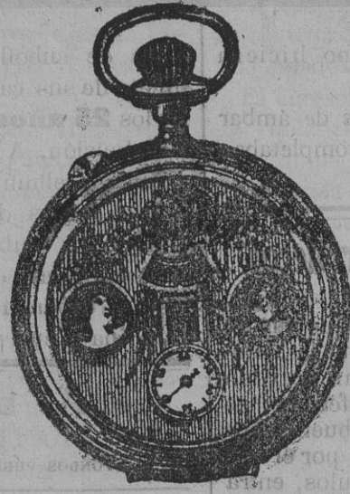
El maravilloso reloj automático

THIERRY.—GRAN RELOJERÍA DE PARÍS FUENCARRAL, 59.—MADRID