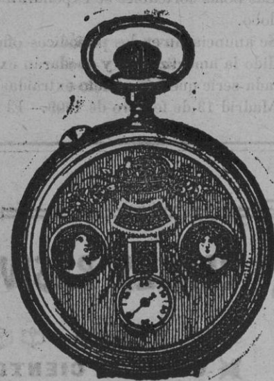
El maravilloso reloj automático