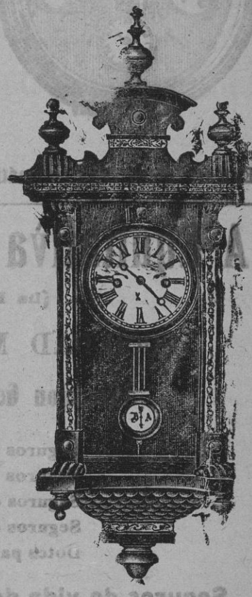
RELOJ REGULADOR de treinta y seis horas, con despertador y horas y medias en dos distintas campanas, caja nogal chapeada, de 68 centímetros de altura. Su precio es de 27,50 pesetas en 5 plazos. Los hay variados en dibujos.

se consideró en la clase de los novales, y se le librá de por tiempo no tan sólo del diezmo, sino de contribuciones civiles. Los industriales catalanes vinieron a morir y á otros puntos de la costa en la provincia de Granada á abaratar este cultivo y á enriquecerse con él sus familias.