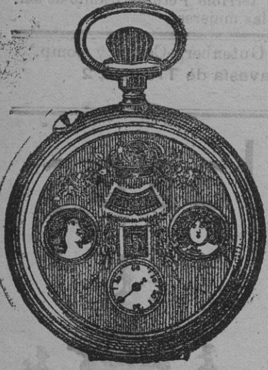
El maravilloso reloj automático