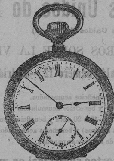
LONGTEMPS que quiere decir reloj de larga vida. Extraplano, en acero, elegantísimo y superior clase, 22,50 pesetas cinco plazos.

Hay un gran surtido de toda clase de relojes tanto de señora como de caballero, á precios muy ventajosos y condiciones de pago inmejorables. Pídase la clase que se desee, en la seguridad de ser bien servido.