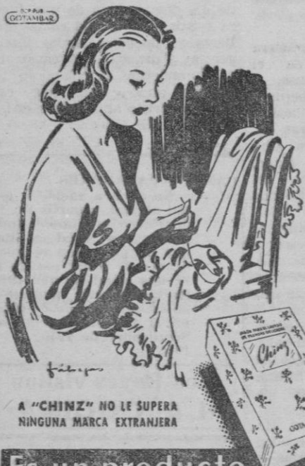
A "CHINZ" NO LE SUPERA NINGUNA MARCA EXTRANJERA

Campo del C. D. Patria a las 4: MAESTRANZA-PATRIA Arbitro Sr. Piña, Anotador Sr. Mulet.