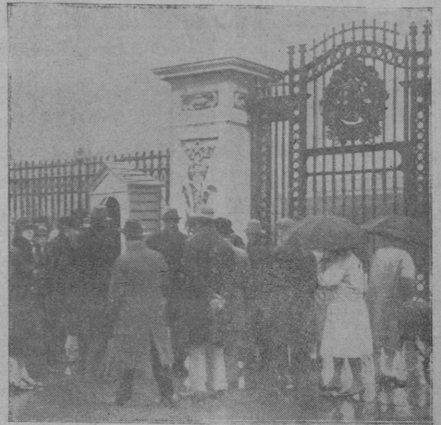
LONDRES.—El público londinense, interesado vivamente por la salud del Rey Jorge V., desafiando las inclemencias del tiempo se aglomera ante el palacio de Buckingham, en espera de noticias sobre el curso de la dolencia del Rey.