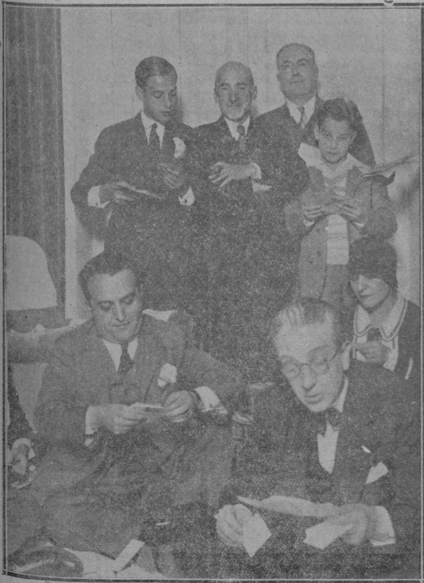
MADRID.—Don Jacinto Benavente a quien se le acaba de tributar un gran homenaje consistente en enviarse una tarjeta indicadora en esta obra que haya sido más del grado del firmante, aparece en esta fotografía con Lola Membrives y algunos de sus íntimos amigos, revisando algunos de los muchos miles de tarjetas recibidas.

Poco después, recibía como contestación: «Cuando el hombre generoso ha dado cuanto tiene, cierra la puerta no verso en la triste necesidad de una vida».