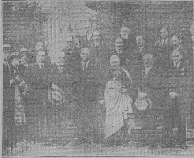
EN EL REFORMATARIO DE AMURRIO (Vizcaya).—Los señores Gobernadores de Vizcaya, Alava y Logroño, que aparecen juntos en el grabado con el Prelado de Valladolid, para tratar de los Tribunales para niños.

Y esta nota de mal gusto debe ser cuanto antes corregida.