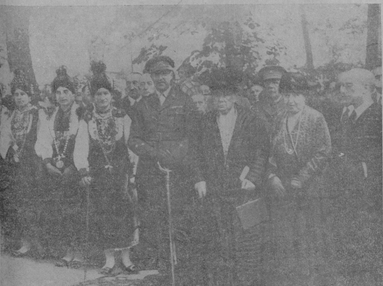
SEGOVIA.—Descubrimiento de un monumento dedicado a la Infanta Isabel, situado en los Jardines de la Granja, a cuyo acto asistieron la Infanta Doña Isabel, el Infante Don Alfonso, en representación de Su Majestad el Rey, el Ministro de Instrucción Pública y las Autoridades de la Provincia.

Como todos los demás astros del cine, yo también recibí una correspondencia muy copiosa. Muchas mujeres me hacen el honor de escribirme. Recibo a veces cartas estúpidas, pero muchas otras son notables y hay algunas extraordinarias. Y cuantas más de estas cartas leo, desde las pocas líneas sin ortografía y escritas