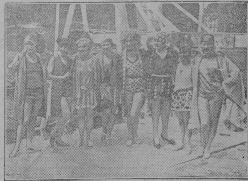
UN CONCURSO DE NATACION EN EL MARNE.—Las concursantes artistas francesas que se disputan la elegancia de sus trajes para los grandes concursos de Natación donde se presentaron otros modelos de países extranjeros.