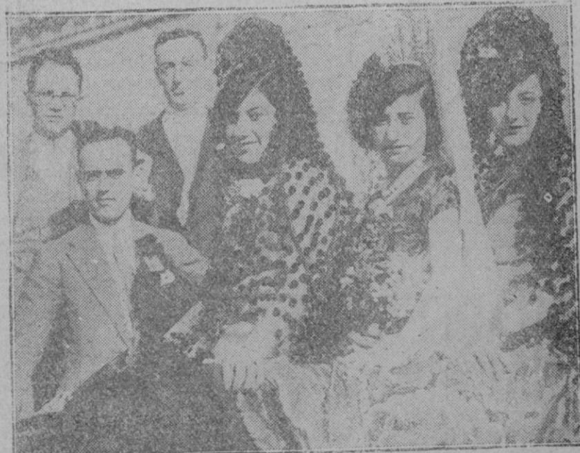
MADRID.—Bellas señoritas que presidieron la becerrada celebrada días pasados, en el momento de llegar a la Plaza.