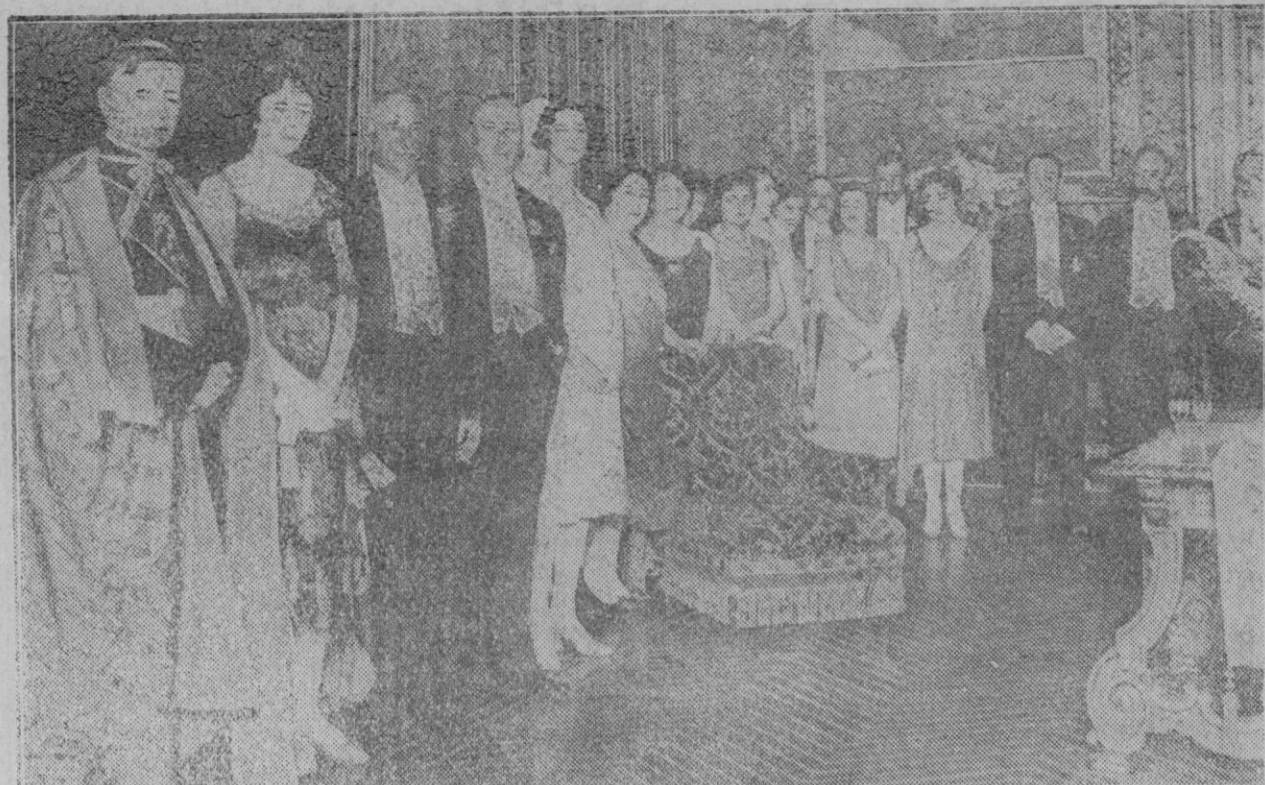
MADRID.—En el Ministerio de Estado se ha celebrado un banquete de despedida a los embajadores de Inglaterra, que marchan a su país, asistiendo el Presidente del Consejo y Ministro de Estado, y el Nuncio de Su Santidad.

Douglas Fairbanks dijo a los periodistas que le interrogaron: «Desde que conocí a Mary adoré sus largos tirabuzones. Pero Mary sabe muy bien lo que hace. Ahora quiere hacer películas representando papeles distintos a los que hasta ahora le han hecho famosa. Mary puede hacerlos y debe hacerlos. Además, en estas cuestiones de películas, Mary sabe más que yo, y tiene la libertad absoluta para hacer lo que crea es más conveniente».