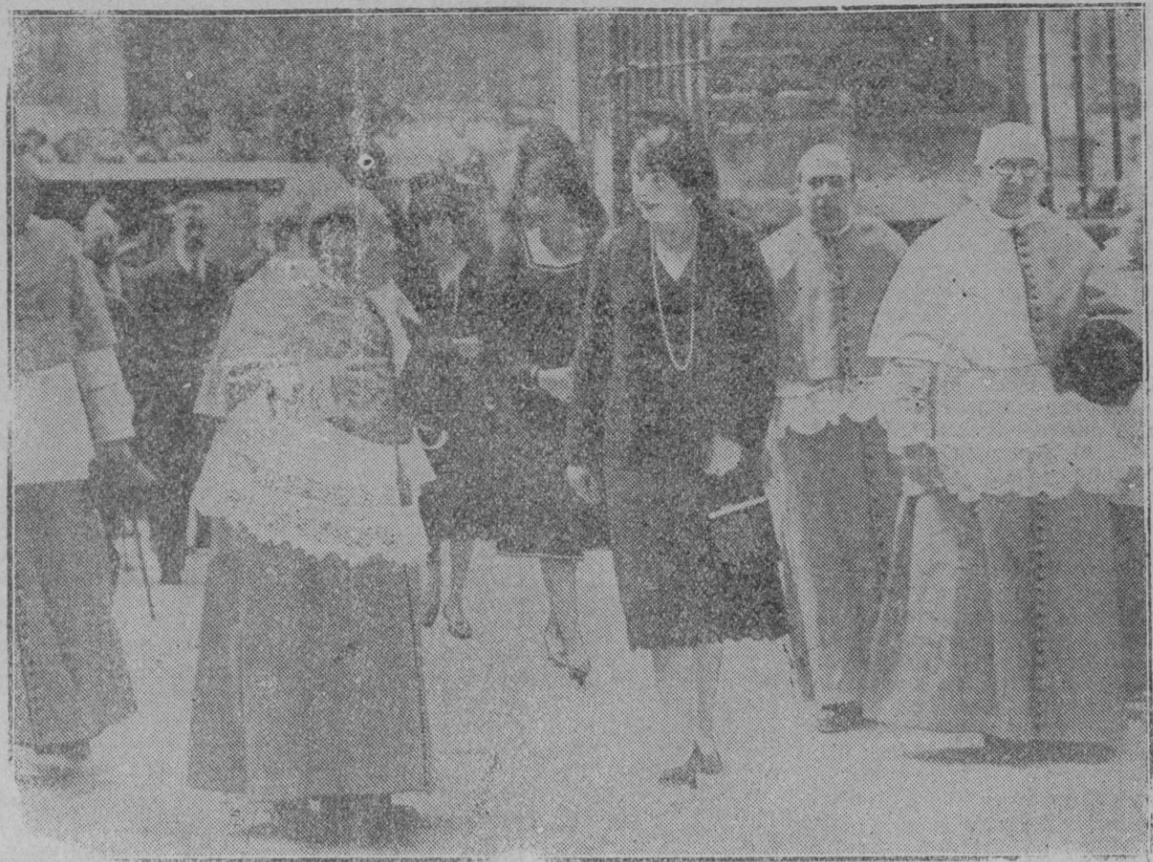
SEVILLA.—Su Majestad la Reina Doña Victoria y las Infantas Doña Beatriz y Doña Cristina, saliendo de la Catedral de Sevilla.