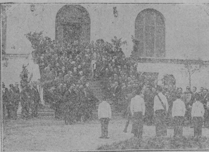
MADRID.—La concurrencia que asistió a la inauguración de la Casa de la Familia, celebrado el domingo pasado en Carabanchel.