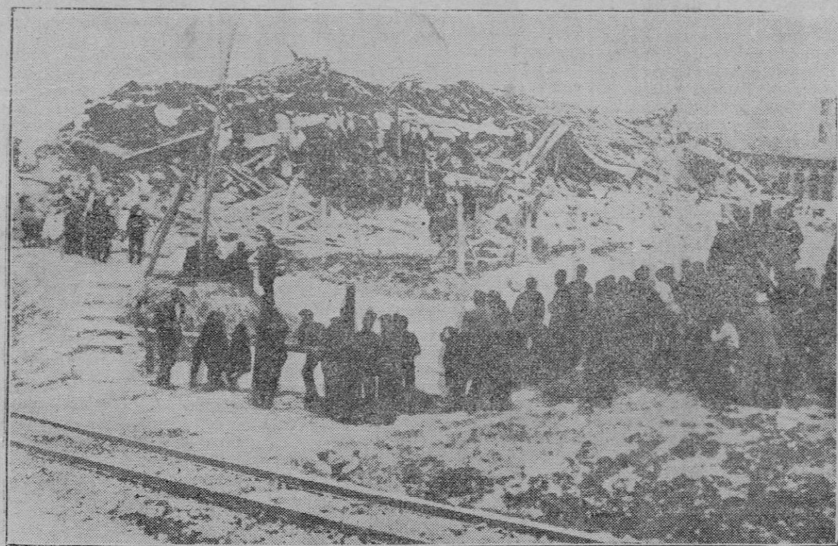
LOS TERREMOTOS EN BULGARIA.—Ruinas del edificio de seis pisos del Banco Popular de Chirpan, que quedó convertido en un montón de escombros.

En Hamburgo trabaja una máquina alemana que extrae automáticamente el aceite de las semillas de aceituna o algodón.