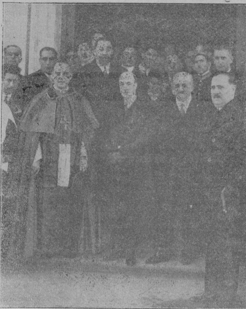
MADRID.—El Ministro de Instrucción Pública, el Obispo de Madrid-Alcalá, el Alcalde de Madrid con otras personalidades, saliendo de la antigua ermita de San Antonio de la Florida, donde se dijo una misa, en sufragio de Goya.

Ese ha sido siempre nuestro objetivo, y es al parecer el que persigue la Compañía Telefónica Nacional, por lo que el propio tiempo que celebramos muy cumplidamente la inauguración del teléfono de La Puebla, Alcudia y su puerto, celebramos también los propósitos de aquella Compañía que nos fueron manifestados por el señor Alonso, en la visita que tuvo la atención de hacernos.