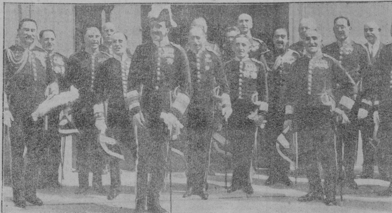
MADRID.—Su Majestad el Rey, saliendo del cuartel de Alabarderos donde se celebró con gran solemnidad la fiesta de San Hermenegildo, Patrón del Real Cuerpo citado.

He aquí un modelo de tratado, que es a su vez, un modelo de comportamiento colonial. Todo está previsto para que a la potencia mandataria, no le cueste un cuarto su protección y saque al mismo tiempo las mayores ventajas, lo cual no impide que