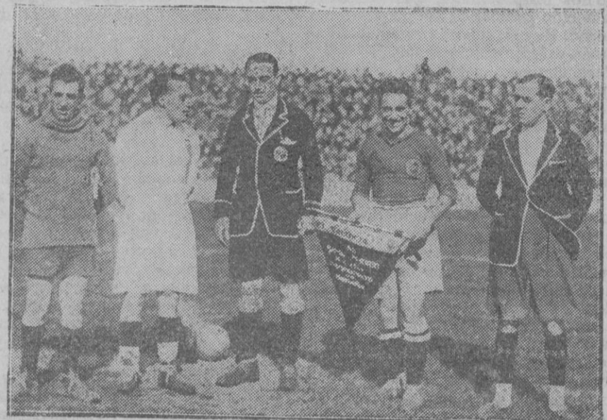
MADRID.—Los capitanes de los equipos del Madrid y del Valencia, después del cambio de banderines, con el árbitro y jueces de línea, antes de empezar el partido en que quedaron empatados y que para el Madrid tenía una gran importancia y que ha de repetirse en Valencia el próximo domingo.

Con la jornada de hoy ha sufrido un rudo golpe el señorío del corporativo cow boy (aún lleva, con muchos de sus principales secuaces, el típico sombrero) quien en 1915 arrebató a los demócratas la administración municipal de la ciudad y llegó a ser, con turbias organizaciones, el personaje más influyente del Estado del Illinois.