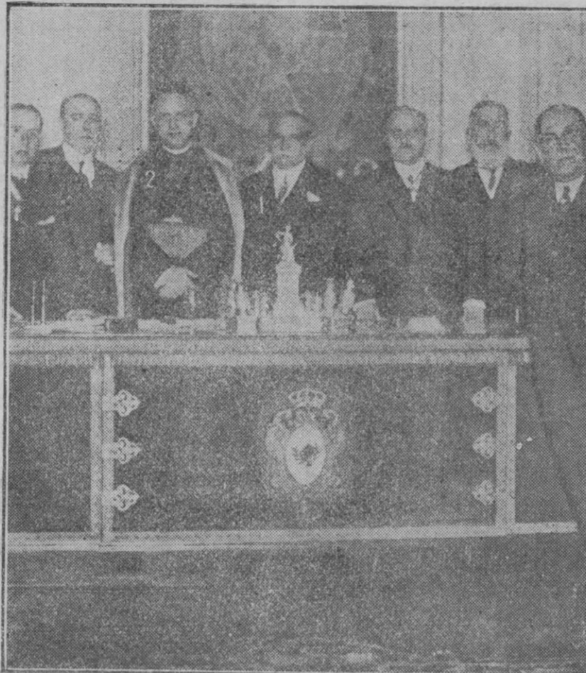
LA CASA DE LOS NOTARIOS EN MADRID.—Momento de la inauguración del edificio del Colegio Notarial por el Ministro de Gracia y Justicia y el Obispo de Madrid-Alcalá.