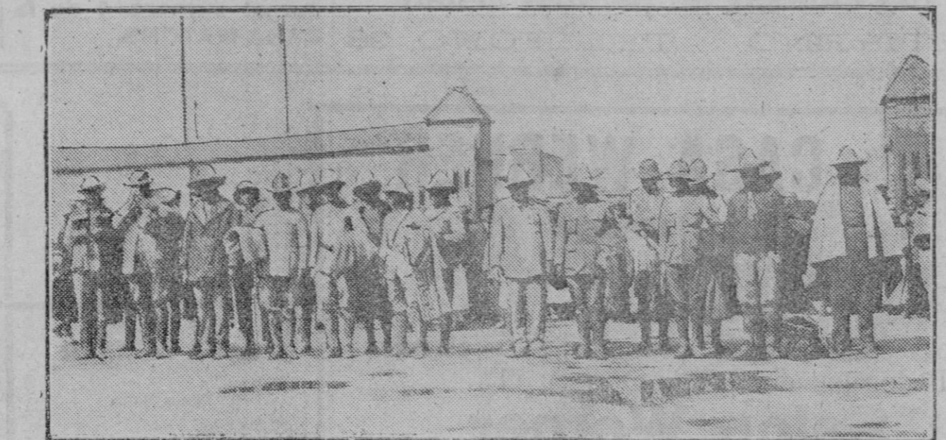
DE LA REBELION DE MEJICO.—Momento de la llegada de los 43 oficiales rebeldes a la prisión militar de San Lázaro, de Méjico, hechos prisioneros por los rebeldes.

Cuatro días, en efecto, parejas de turistas ingleses, tomando la casa por un restaurante, entraron en ella, se acomodaron en la veranda y, con la naturalidad y la autoridad con que se piden las cosas en los sitios en que