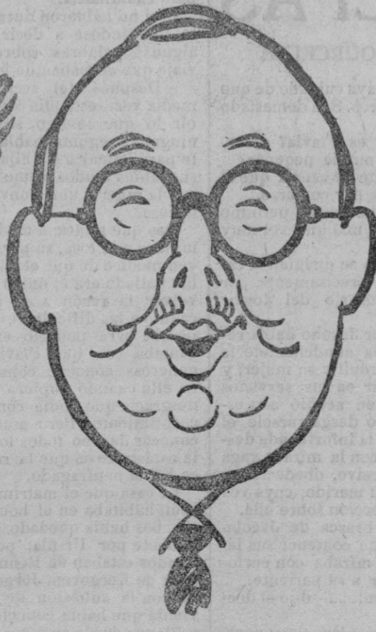
D. Ignacio de L. Ribera Rovira, actual Presidente de la Federación de Prensa Española. (Caricatura de Picarol).