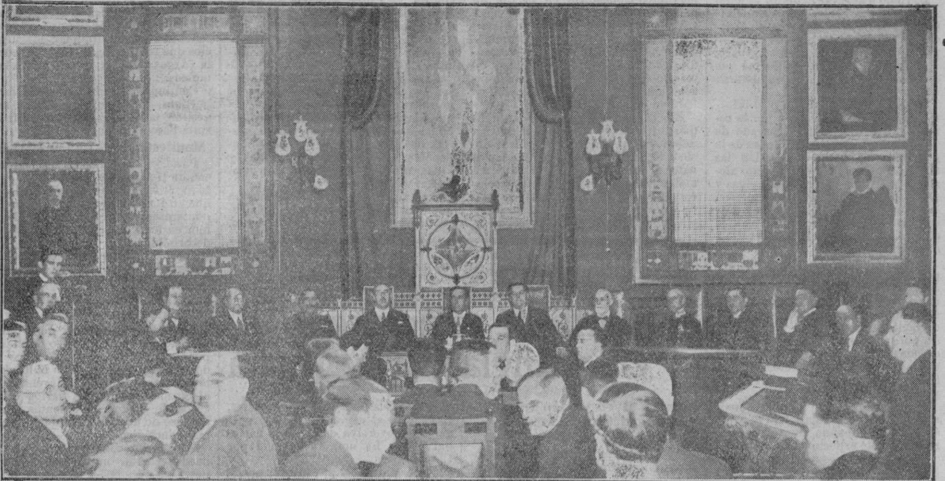
Solemne sesión de apertura de la V Asamblea Nacional de Prensa, celebrada en el Salón de Sesiones del Ayuntamiento de esta ciudad.