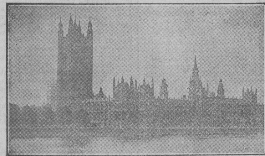
El Parlamento de Inglaterra, que tanto relieve ha adquirido estos días con motivo del viaje a Londres del Presidente de la República francesa y el Ministro francés señores Doumergue y Briand.