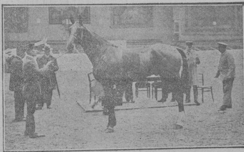
EN EL «GRAND PALAIS».—EL CONCURSO HIPICO Presentación de bellos ejemplares de caballos de silla.