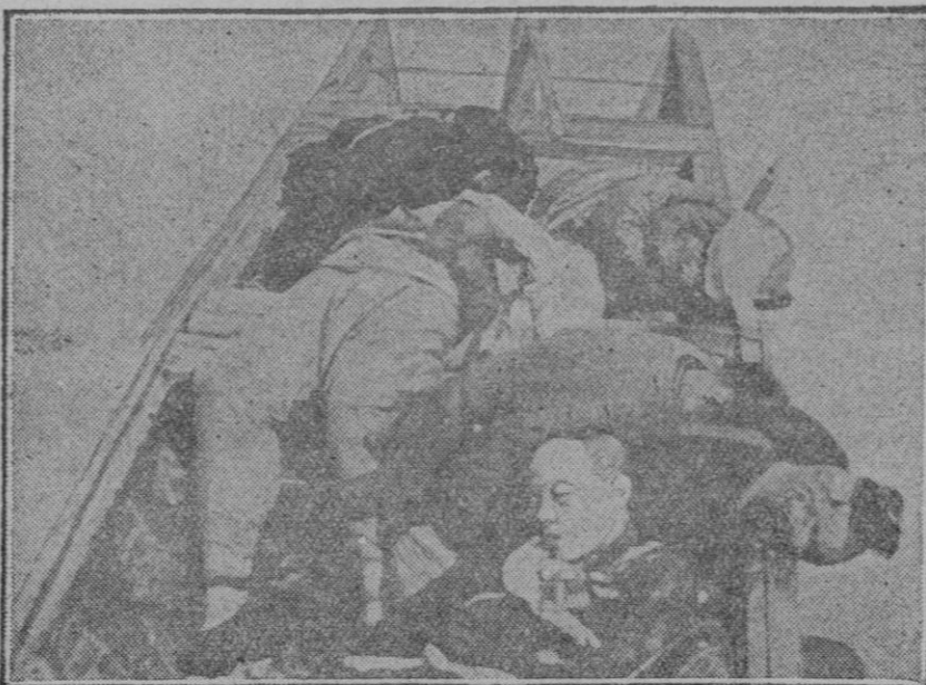
LOS HORRORES DE LA GUERRA CHINA Esta fotografía tomada en Hankón, representa una de las barcas que cargadas de cadáveres de los combatientes son transportados a través del río Yangsé.