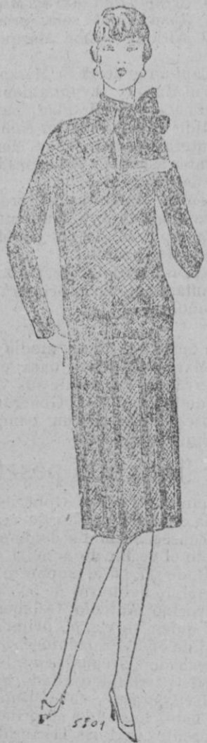
TRAJE.—«Naja» Traje estampado piel de serpiente, adorno de terciopelo negro.

En los vestidos de calle o para el té y de visita, hay que notar una pequeña revolución; la desaparición de las mangas, cuya ausencia se advierte en muchas colecciones. Los brazos aparecerán casi como antaño, completamente desnudos, pero en compensación veremos el cuello completamente cerrado, dando así ocasión para lucir lindas corbatas que siempre deberán armonizar con el color del vestido.