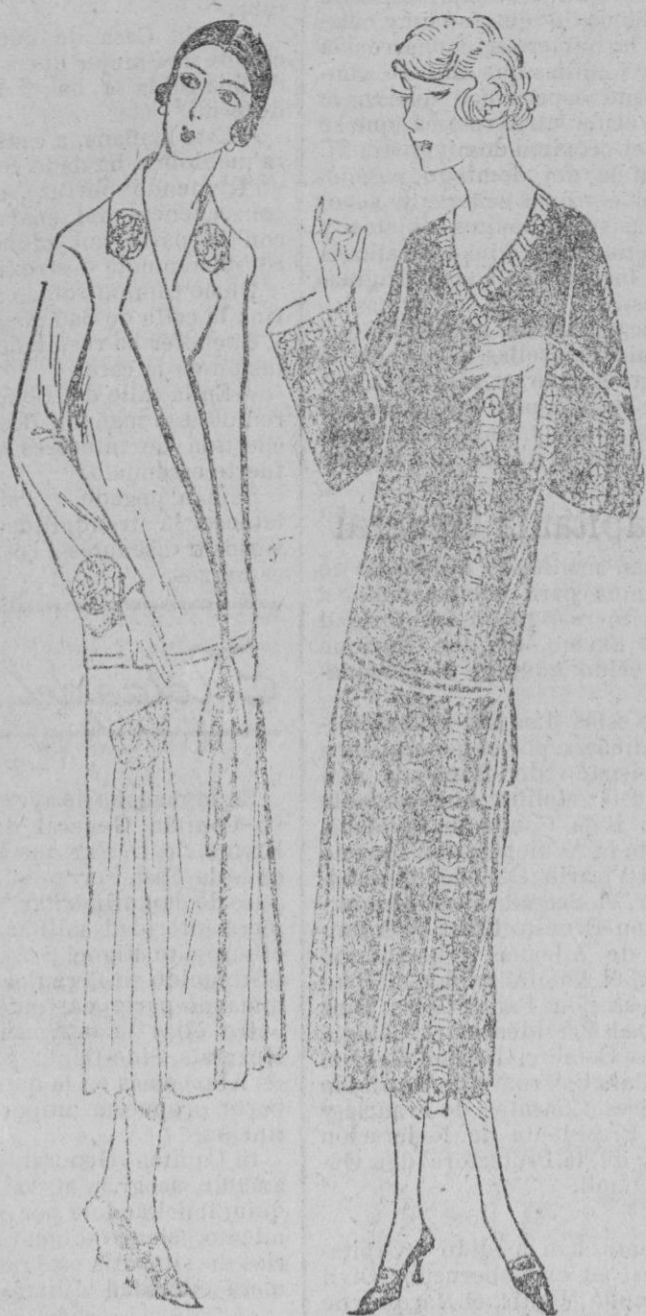
DOS DESHABILLES.—Presentamos en esta figura un peñador en crepé de china azul bordado con motivos plata y azul marina.—Metrage 3 m. de 1 m. Deshabillé de terciopelo encarnado orlado con un galon rosa y oro.