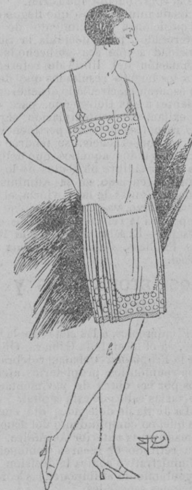
CAMISA-REFAJO.—Presentamos en esta figura una combinación-camisa refajo, ya que se toma cada vez más la costumbre de simplificar y de reunir estas tres piezas en una sola. Aquí, pues, vemos un exquisito modelo de crepé de china blanco, horlado con círculos de seda del mismo tono. Grupos de pliegues sobre las caderas dan vuelo a la marcha.