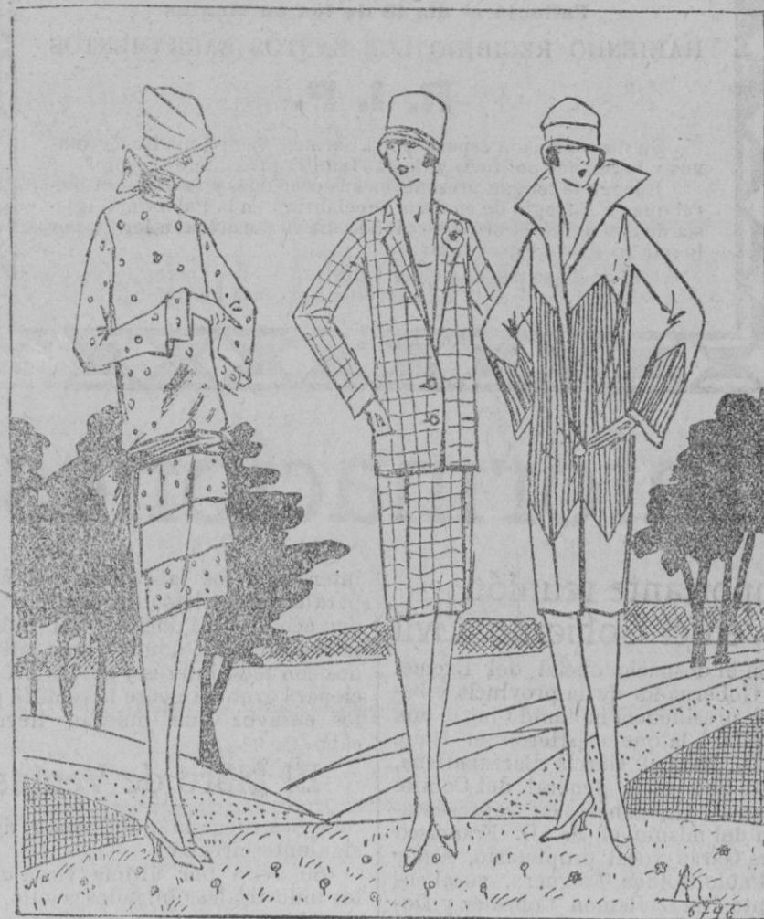
PANORAMA TOALETAS.—1 Traje casha cloudory casha unido. Cuerpo bluseado sobre cintura de seda. Falda de volantes planos.—2 Tailleur de lanaje cuadrulado en tonos grisalla.—3 Abrigo de crepé de china plisado.

Place a las elegantes el dotar cada hora del día de una toaleta adecuada. He aquí trajes de tarde tan trabajados que serán llevaderos para las cenas íntimas.