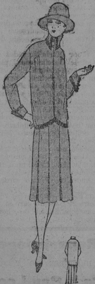
TRAJE.—Traje-abrigo de sergatina azul marino y satén negro.