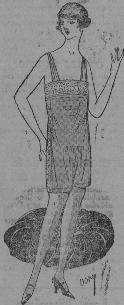
CAMISA-PANTALON.—Presentamos en esta figura una exquisita camisa-pantalón, muy fácil de confeccionar y con la que se puede emplear bien un pequeño cupon de tela. Establecida en tela tarara malva y adornada con entredos de Rosalina, ligeramente ocreada, será encantadora. A notar el calado por delante, el grupo de pliegue, dando holgura al pantalón y a la hombrera doble de terciopelo ciclament.

los... estos modelos son creados a menudo por modelistas no habiendo jamás viajado y que se figuran que el Perú está aun habitado por Incas, que la Florida hormiguea de Indios Sioux «con plumas».