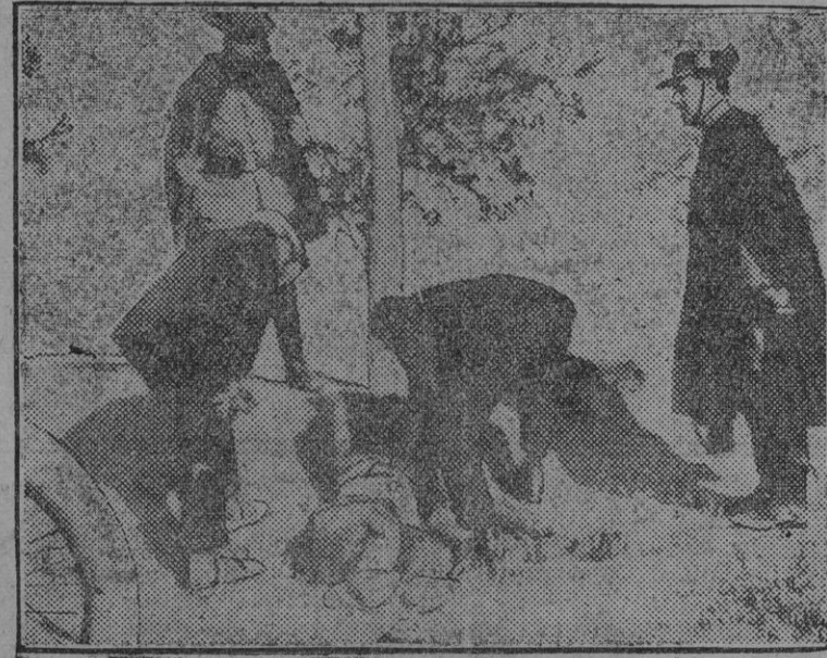
Momento en que se le daba un vaso de agua al desgraciado Inocencio Mateos en el lugar en que quedó herido de muerte.