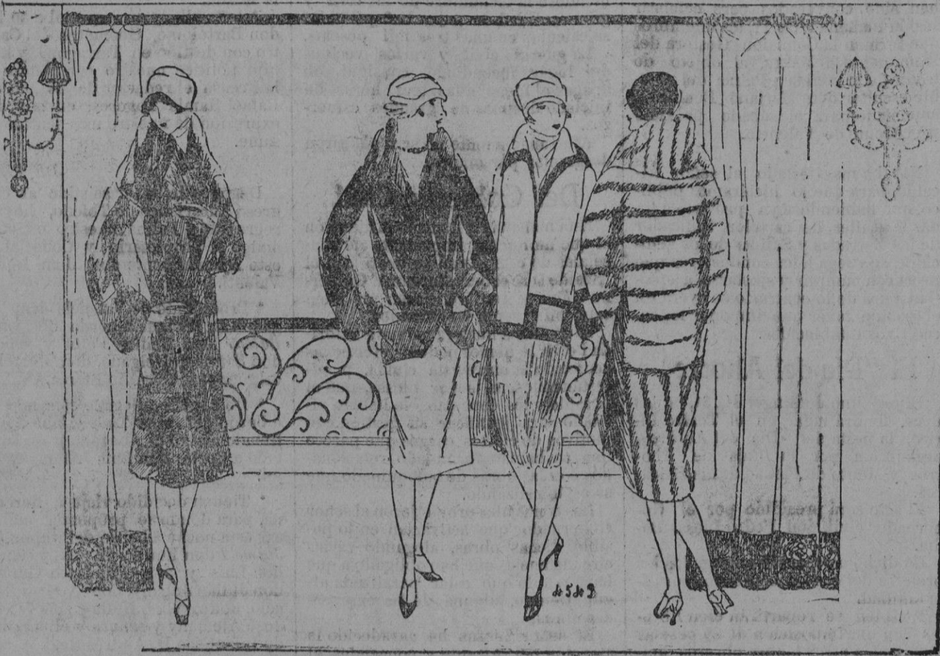
PANORAMA DE PIELES.—Si la temporada fría nos inspira alguna melancolía, la coquetería femenina conoce al menos encantadoras compensaciones. Los abrigos de piel son por ello cada vez más elegantes. He aquí al azar de la bella colección de Grunwaldt. Celina flexible, capa de bisonte; Bruyere, hermoso pequeño pel to de nutria de Hudson; Marinette, gracioso abrigo de topo muy finamente trabajado y Alix, casaca de petro negro de adornos y faldones de cordero afeitado.