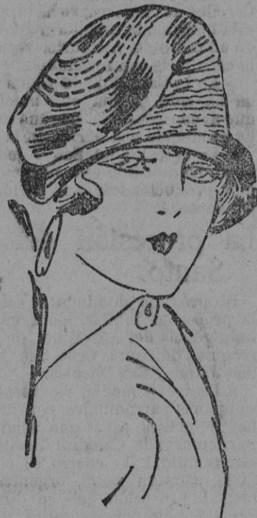
SOMBREIRO.—De terciopelo picado

cual, sino de hacer penitencia, un gran sacrificio; simultáneamente y el fabricante de tisú y el proveedor de adornos y el gran costurero deberán bajar sus precios de 60 a 100 p. Es necesario que cesen esas superposiciones de 30 y 40 p. por gastos de mantención, de exclusividad de modelos, de pérdidas y ganancias sobre los cortes, etc. Sino es tal vez el desplazamiento del plato de la moda cuyo cetro pasara de la alta a la mediana costura, véase a la confección.