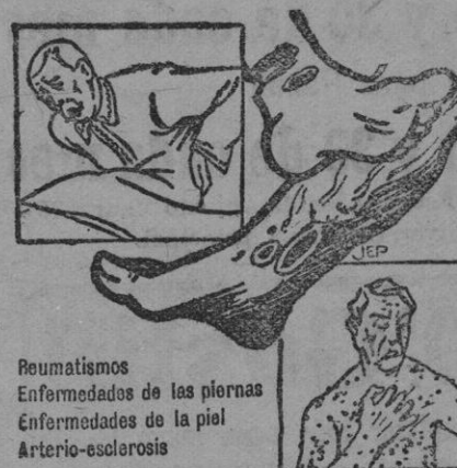
Rumatismos Enfermedades de las piernas Enfermedades de la piel Arterio-esclerosis

Única casa que solamente vende Medias y Calcetines a precios como nadie. SAN MIGUEL 50 y 52 PALMA