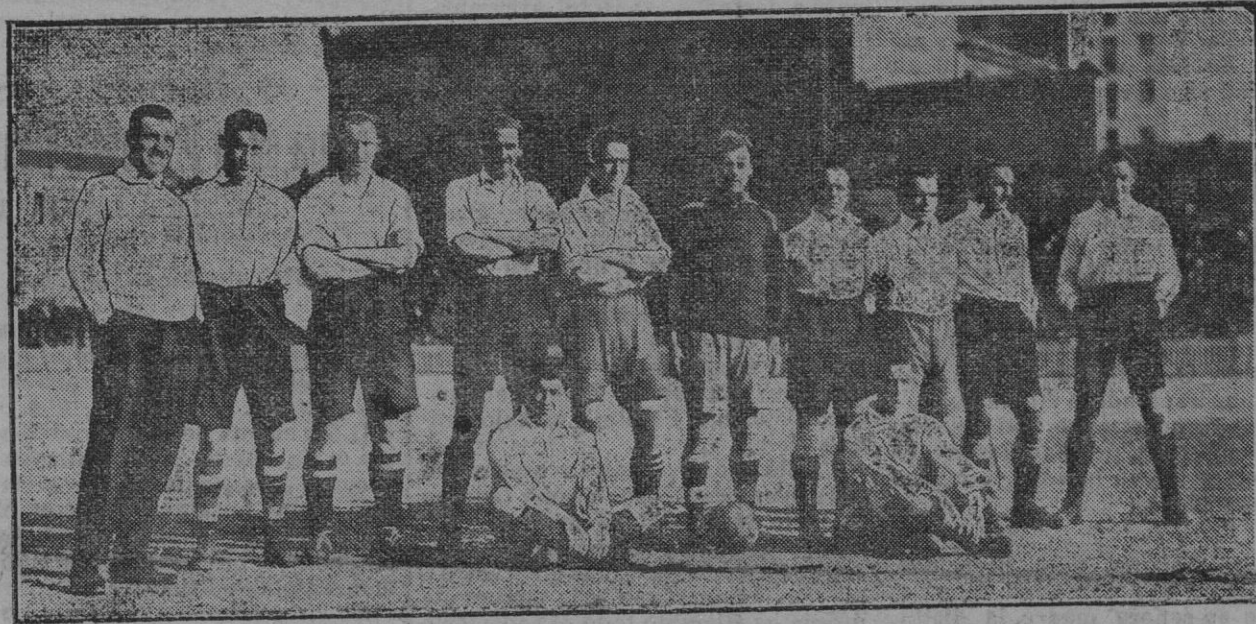
El equipo del Civil Service que jugó con la Gimnástica en Madrid