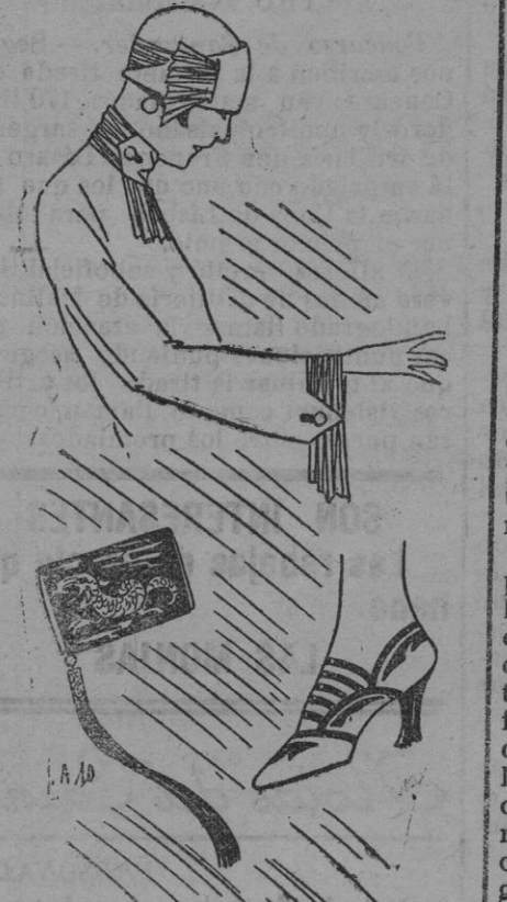
Algunas fantasías del plisado.—Cartera en seda de china bordada y adornado con una borla de seda.—Zapate en dos tomos de piel.

Los efectos de grandes lazos y volantes levantados nos llevan igualmente al estilo 1880.