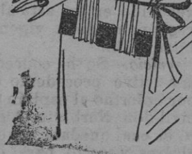
Blusa de crepé georgette color limón y azul marino, adornado con vainicas.