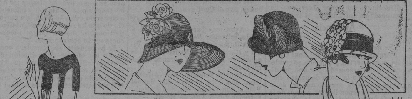
Capelina en erin malva, bordeado de terciopelo malva y adornado con una cinta y flores de diferentes colores. 2.º Pequeño sombrero de fieltro marrón, adornado con dos espigas, beige y oro.—3.º Sombrero en bengala natural, adornado con terciopelo escama y flores beige y escama.