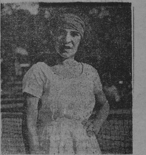
CAMPEONATO DE TENNIS.—Ma dame Suzanne Lenglen, después de la victoria de Wimbledon.