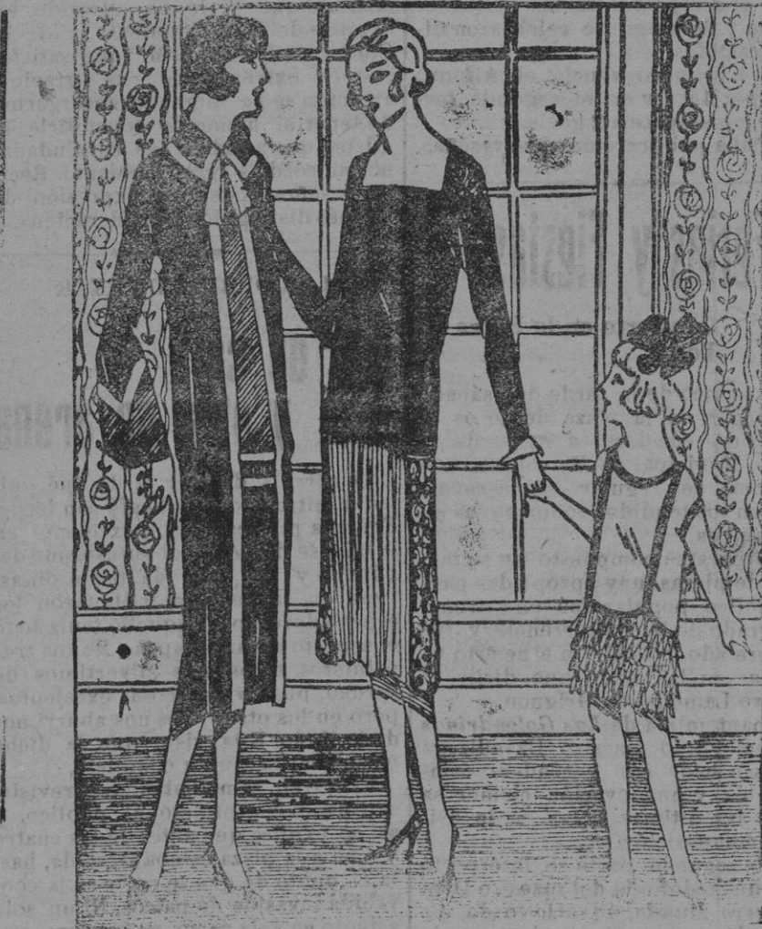
Vestido en crepé satin negro y crepé georgette malva.—Vestido en crepé mah-jong negro, bordado en rojo negro.—Pequeño vestido en crepé georgette rosa, adornado con volantes plisados.

Hemos visto en el restaurante elegante un sombrero verdaderamente