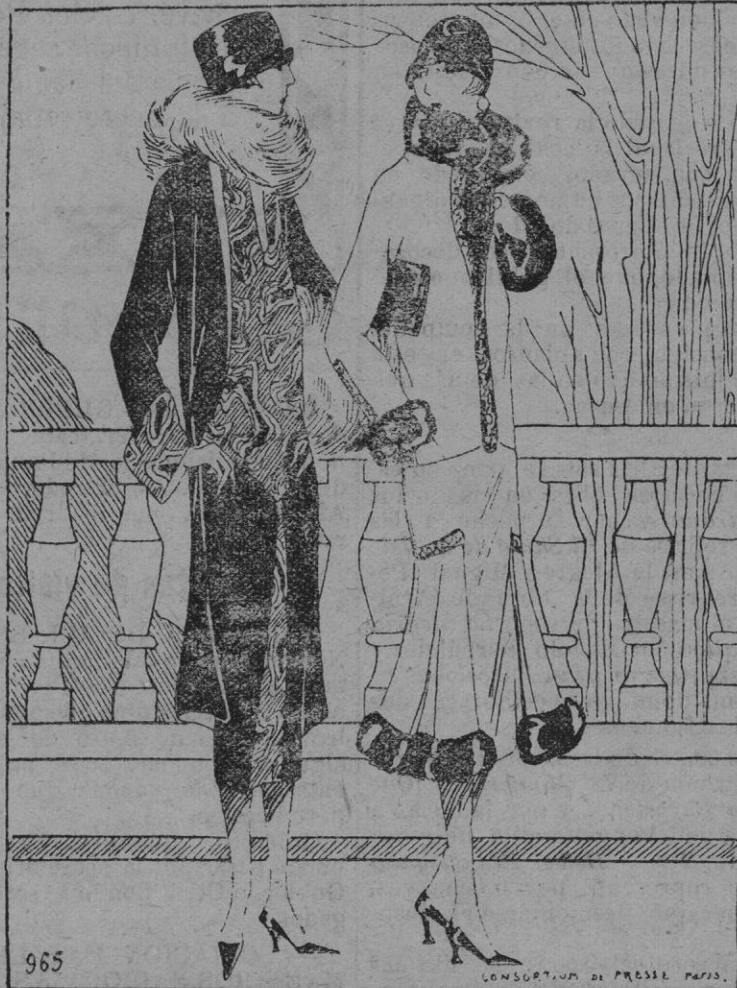
1.º Traje en «crasha» bleu marino y crepé impreso chadron, marino y verde. 2.º Tailleur en «ziblish» beige adornado con piel de loutre.