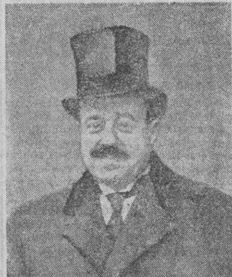
Nuestro embajador en Francia, señor Quiñones de León, cuya renuncia a ser ponente en la árdua cuestión de la Alta Silesia ha sido universalmente comentada.