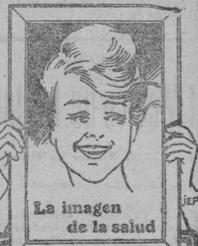
La imagen de la salud

Se necesita.—Informes, Centro de Anuncios.