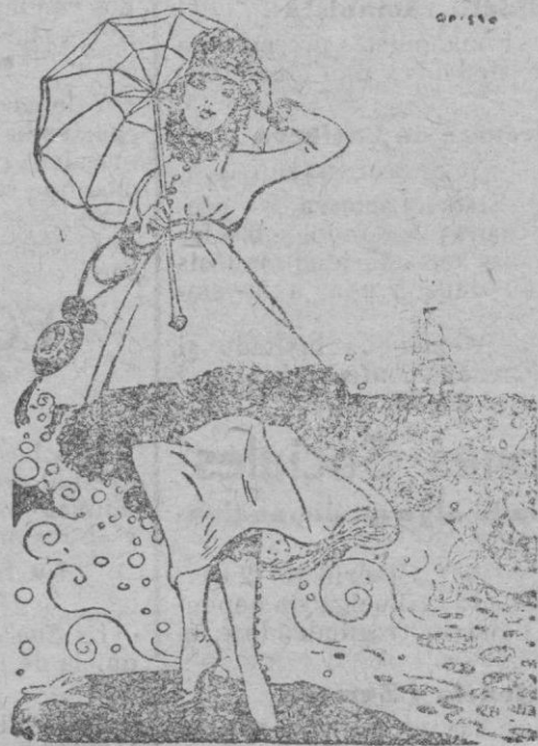
Las bañadas del mar envidan el perfil de tu figura; el rúscor, en la siva, car tu una cada tu hermosura porque saben que te aces con productos P&C A CURA.

Pedidos e informes D. M. PORTOLES DE AZNAR, Santa Feliciano 13, Madrid. Venta en Palma, CENTRO FARMACEUTICO.