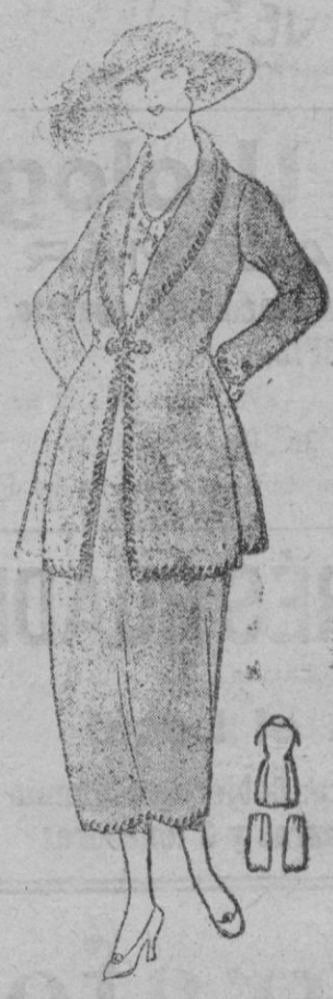
Ultimos figurines de Otoño