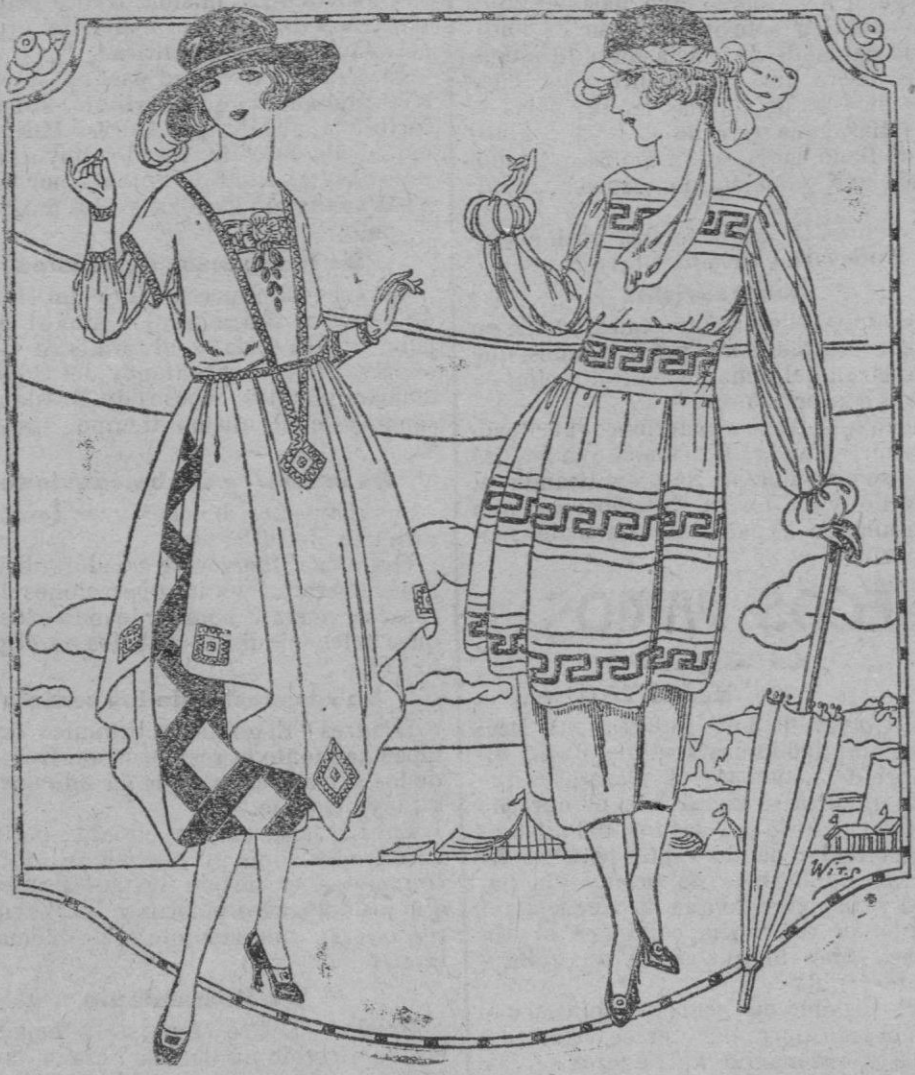
Modelos de figurines para verano