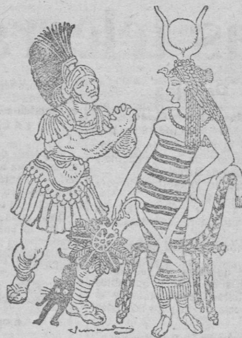
Marco Antonio a Cleopatra siempre bella la encontró. Cleopatra en su tocado, PROA CURA siempre usó.

Véase relación en el domicilio de la Liga, Sants 4, bajo