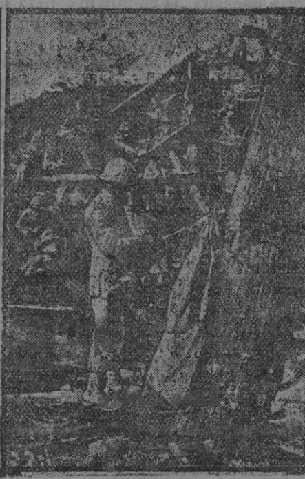
Después de la batalla.

El ejército italiano está empleando los torpedos aéreos, en gran cantidad para romper los obstáculos que colocan a vanguardia de sus trincheras las tropas austríacas.