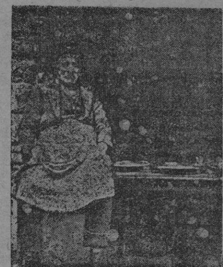
Un pastelero indio

El periódico holandés Nieuws van de Dag escribe con respecto a la manifestación inglesa sobre la declaración de