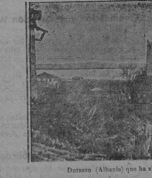
Durazzo (Albania) que ha sido ocupado por los austriacos.