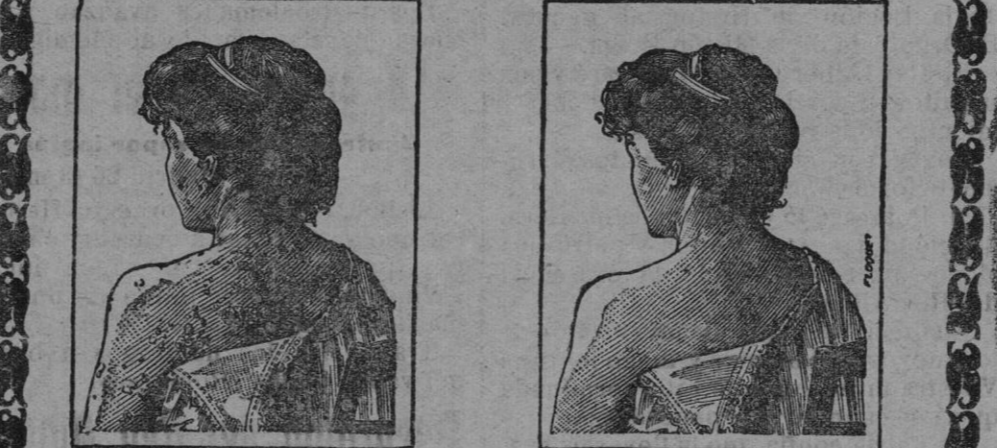
Antes de la curación (left) Después de 15 días de tratamiento (right)