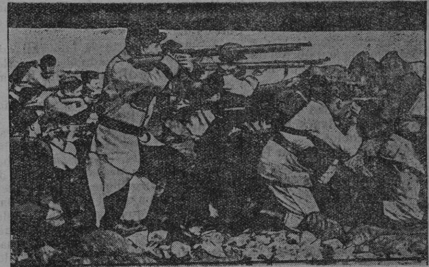
Los franceses avanzando en las dumas.