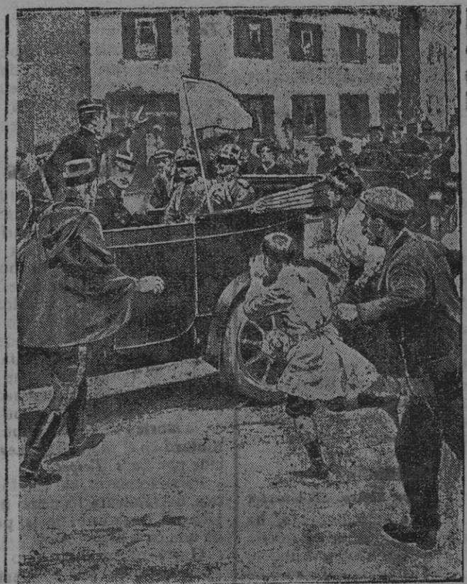
Parlamentarios alemanes que vienen de negociar con los oficiales franceses.