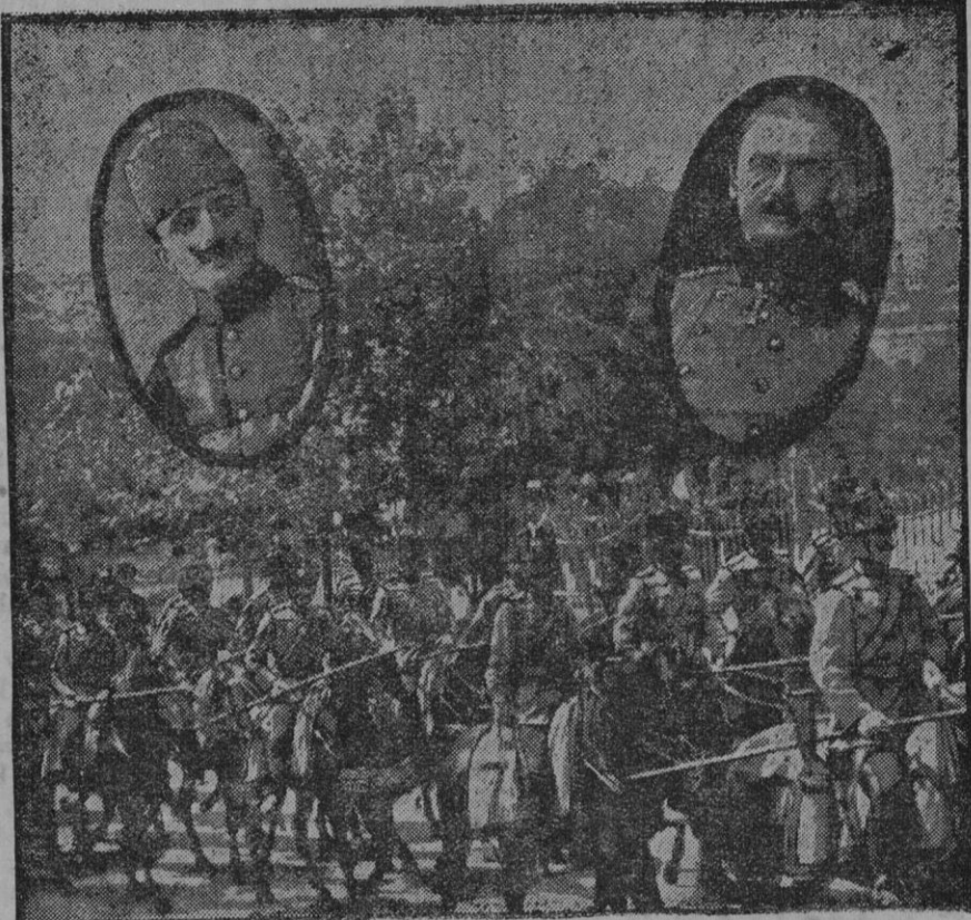
Regimiento de lanceros turcos equipados a la alemana. En el medallón de la izquierda Ruver Bey, Ministro de la guerra turco, y en el de la derecha el general alemán Von Landers, generalísimo de la armada turca