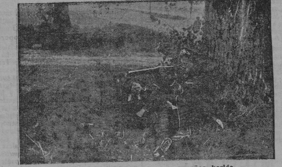
Soldado inglés defendiendo a su compañero herido