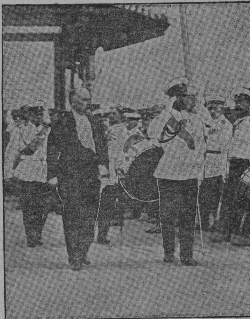
Nuestra fotografía representa al Presidente de la República francesa M. Poincaré y a S. M. el Zar de Rusia Nicolás II desembarcando en Peeterhof del yate imperial «Alexandria» que los había conducido desde Cronstadt.