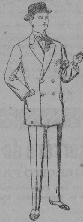
Trajes de vicuña ó jerga, negros y azules De pts. 35 á 73

Gorras, Sombreros de paja, Cinturones, Calcetines, Corbatas, Fajas, Ligas, Tirantes, etc., etc.