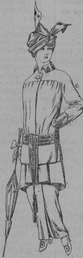
Vestido de lana negra ó azul, para Señora De pts. 35 á 40