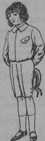
Trajes de lanilla, vicuña, ó jerga para niños de 4 á 9 años De pts. 5 á 10