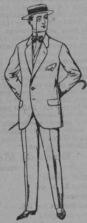
Trajes de lanilla y chaviot De pts. 17'50 a 70