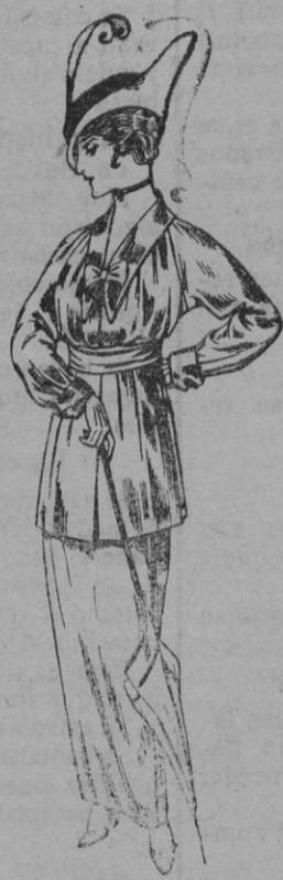
Traje de jerga azul ó ne- gra y géneros nove- dad para Señora De pts. 65 á 80