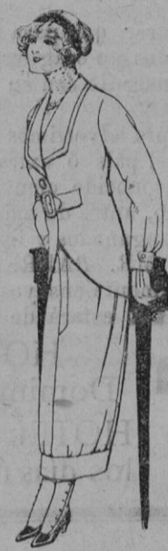
Trajes para juven- citas de 13 á 16 años De pts. 27 á 30