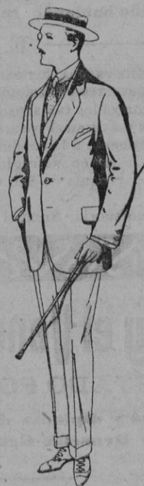
Trajes de alpaca negra De pts. 32 á 56