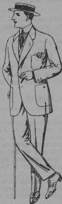
Trajes de dril crudo kaki ó listado De pts. 10 á 32