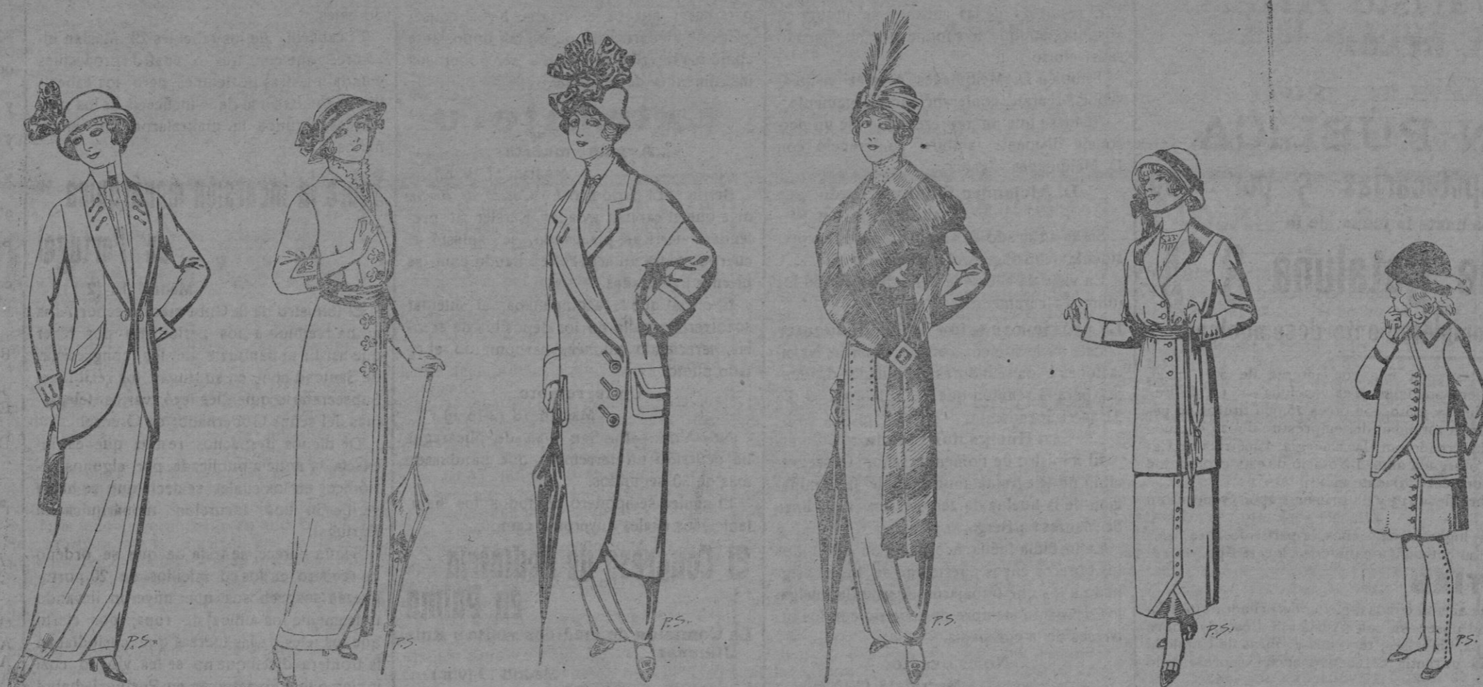
Traje de lanilla o cheviot para Señora a pts. 65 y 70 Vestido de lanilla negra o azul para Señora a pts. 22 Abrigos de paten para Señora de pts. 22 a 30 Juego de pieles para Señora de taupe, Australia a pts. 155 Traje de lana para jovencitas de 14 a 16 años De pts. 40 a 45 Traje para niñas de 4 a 11 años de pts. 14 a 17