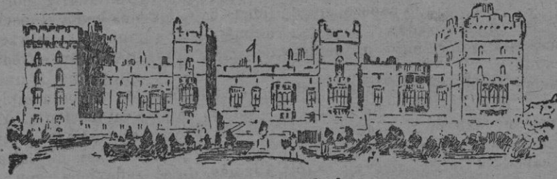
Castillo de Windsor