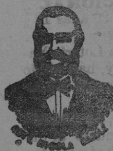
Inventor de los renombrados medicamentos CASILE

han logrado que el Dr. Casile, de Nápoles, descubriera los milagrosos medicamentos que curan infaliblemente la tisis en cualquiera de sus períodos y todas las enfermedades del estómago. A la más pequeña manifestación de un resfriado, tos, catarro, bronquitis, gripe, asma (afectación), expectoración y de cualquier enfermedad del pecho, tomar inmediatamente las Perlas Casile, que no sólo curan infaliblemente estas enfermedades, sino que se tendrá la completa seguridad de no contraer otras mucho más graves. Siguiendo este método se podrá decir no más tisis. Si por desdicho no se hubiera seguido este tratamiento y por desgracia cualquier persona se encontrara atacada de tisis, no tiene que apurarse, porque gracias á los constantes estudios que hemos podido encontrar los renombrados Condes Casile, que asociados á las Perlas combaten con eficacia la tisis en cualquiera de sus períodos.