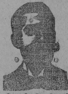
Angelo Costanzi Diputación, 435, ent.º Barcelona

18 años de éxitos son la mejor garantía de que los Polvos cosméticos de Franch, matan las raíces y no vuelven á reproducirse. Este depilatorio es muy útil á las personas del bello sexo que tengan vello en el rostro y en los brazos, pues con él pueden destruirlo sin irritar el cutis. — 2/60 ptas. bote. Se vende en las principales farmacias.—En Palma: en la Farmacia de D. Juan Valenzuela, P. Cuartera, 14.