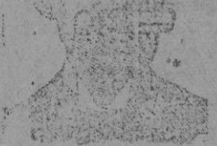
Diputación, 45, Bar.

CONSTITUCION ANTIVENEREAS Y ROOS ANTISIFILITICO COSTANZI